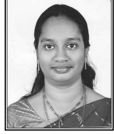
శ్రీమతి కె. ప్రసన్న పరాక్రమ్

సామెతలు 22 నుండి 31 మరియు ప్రసంగి 1 నుండి 10 వరకు